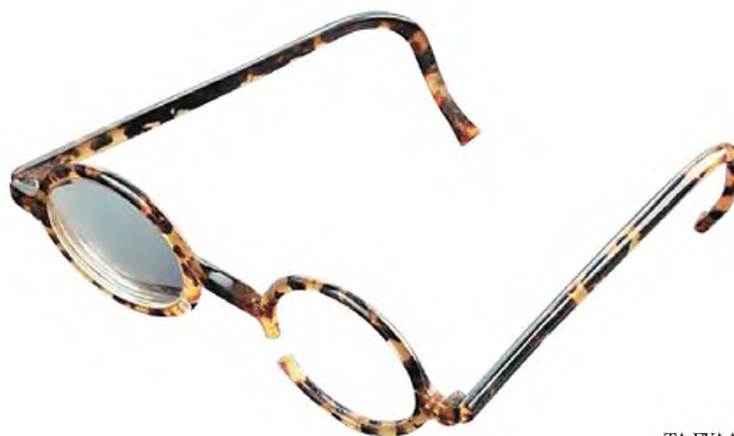
ΤΑ ΓΥΑΛΙΑ ΤΟΥ ΚΑΒΑΦΗ (ΕΛΛΗΝΙΚΟ ΛΟΓΟΤΕΧΝΙΚΟ ΚΑΙ ΙΣΤΟΡΙΚΟ ΑΡΧΕΙΟ)

ΕΠΙΜΕΛΕΙΑ Γ.Π. ΣΑΒΒΙΔΗ. ΤΑ ΠΟΙΗΜΑΤΑ, Τ. Β' 1919 - 1933, ΙΚΑΡΟΣ 1963